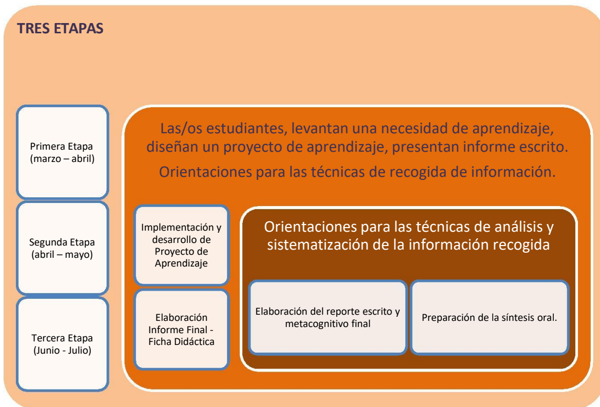
FIG. 3: Procedimientos y Estrategias Metodológicas.