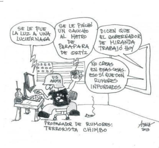
Autor: Ayala (2013) Tomado de: correo del Orinoco 5 de marzo de 2013