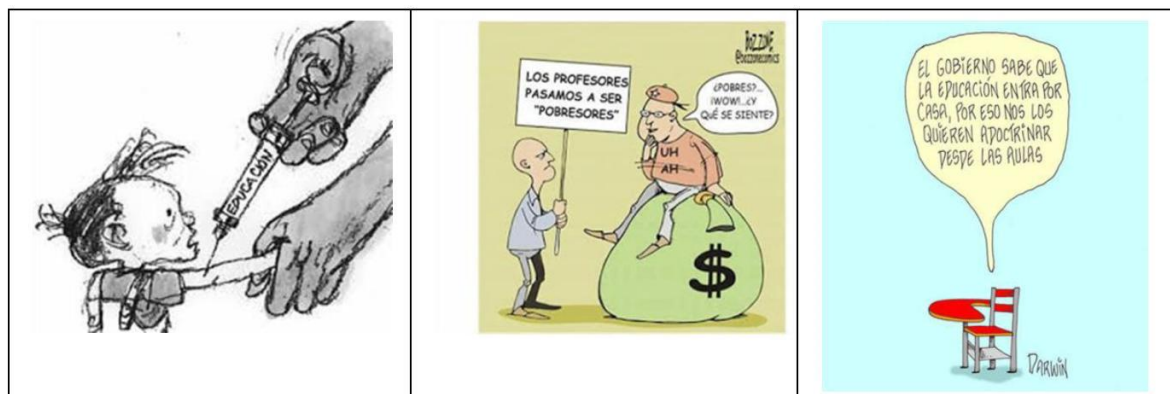
Gráfico 4: Caricaturas