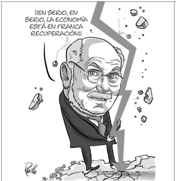
Autor: Pinilla (2010) Tomado en: http://twicsy.com/i/9Zyot