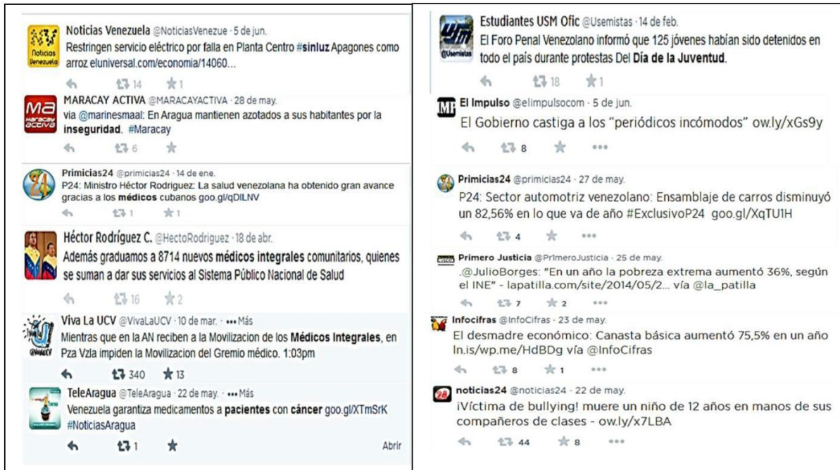
Gráfico 2: Panorama social. Una visión desde el Twitter.