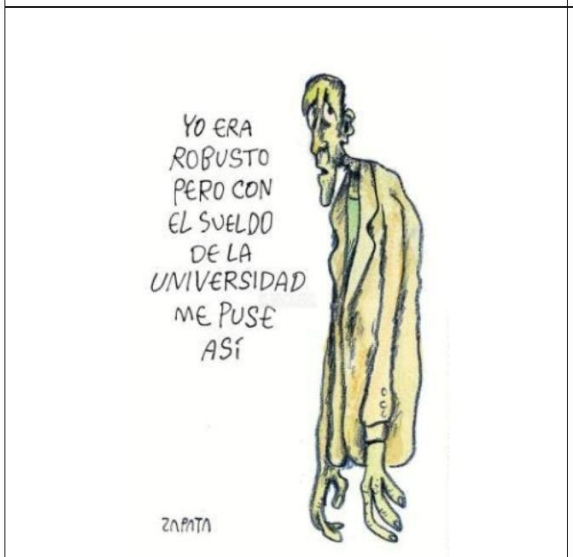
Autor: Zapata (2013)