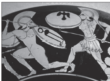
Imagem 2 2 : Cílice. Siglo VI a.C. Hecho en Ática, encontrado en Italia (Viterbo). El combate de Menelao con París, mención de la Guerra de Troya. Para beberse el vino, trayendo la bebida a la boca.