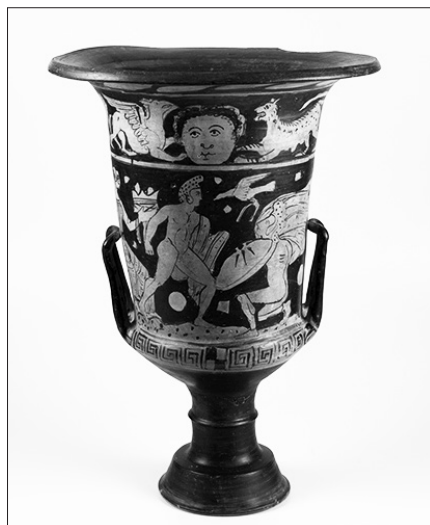
Imagem 1 1 : Crátera en Cálice, Italiota. Siglo IV a.C. Italia Meridional, Campânia. La escena representa el combate entre los dos guerreros Etócles y Polinices. Un pájaro entre ellos lleva una cinta de victoria (tenia). A la izquierda, una mujer sentada sostiene una bandeja de ofrendas. En la decoración superior, una cara frontal femenina está flanqueada por un grifo y una pantera. Estos se usaron para mezclar agua y vino, dependiendo de la ocasión y la necesidad.

Finalmente, en un diálogo entre el espacio de las ciudades y el material disponible de cerámica, lo que podemos percibir es precisamente el conjunto de signos que dan voz a varios elementos relacionados con la